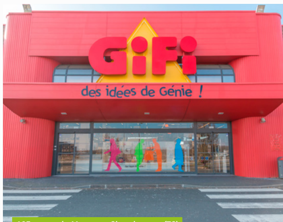
105, route de Mantes – Chambourcy (78)

Le 1 er octobre 2022, BNP Paribas Securities Services (BP2S), banque dépositaire de votre SCPI Pierre Sélection, a fusionné avec sa société mère BNP Paribas. BNP Paribas devient donc la banque dépositaire de votre SCPI, sans incidence sur les fonctions et opérations mises en place par la société de gestion, BNP Paribas Real Estate Investment Management France.