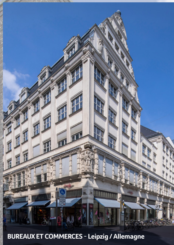
BUREAUX ET COMMERCES - Leipzig / Allemagne