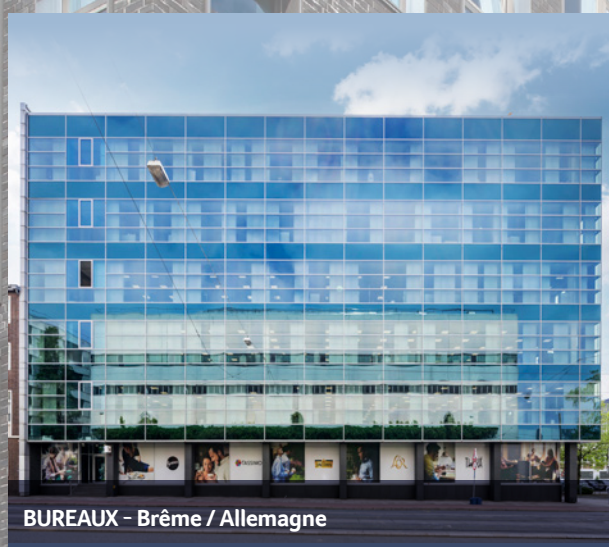
BUREAUX - Brême / Allemagne