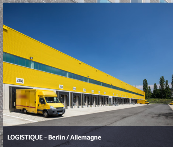
LOGISTIQUE - Berlin / Allemagne