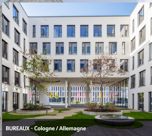
BUREAUX - Cologne / Allemagne

Les revenus fonciers de source allemande imposables en France et donnant lieu à crédit d'impôt sont déterminés selon les mêmes règles que les revenus fonciers de source française. A ce titre, l'impôt allemand n'est pas déductible du revenu imposable en France.