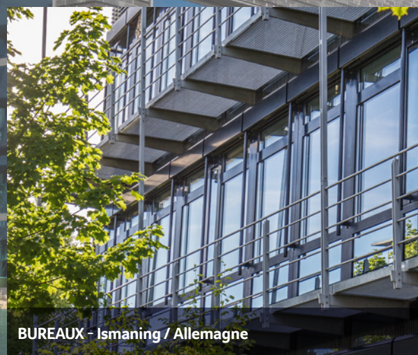
BUREAUX - Ismaning / Allemagne