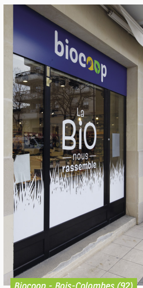
Biocoop - Bois-Colombes (92)

Ces relocations auront un impact positif sur le taux d'occupation ASPIM, de manière progressive, les relocations étant accompagnées de franchises en début de bail (considérées comme de la vacance dans le calcul du TOF ASPIM).